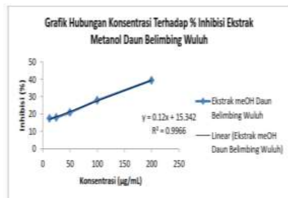
Gambar.2. Grafik Hubungan Konsentrasi ppm Larutan Uji Estrak Metanol Daun Belimbing Wuluh

Dari penelitian uji aktivitas antioksidan ekstrak metanol ini digunakan sampel daun belimbing wuluh. Lokasi sampel di ambil di salah satu kota Baubau yaitu di Kelurahan Lipu Kecamatan Betoambari. Waktu pengambilan sampel dilakukan pada pagi hari jam 07:00 WITA.